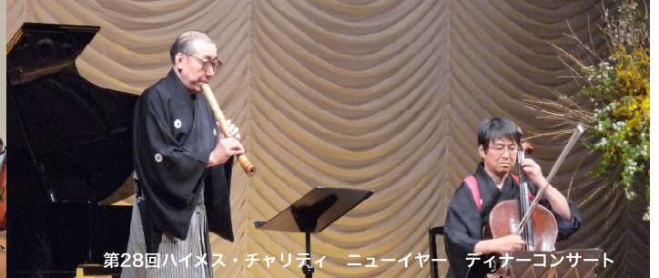
第28回ハイメス・チャリティ ニューイヤー ディナーコンサート