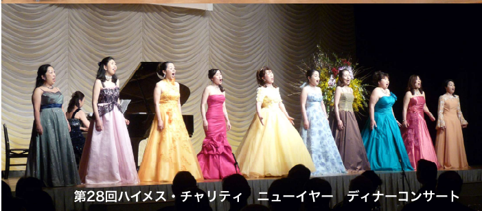
第28回ハイメス・チャリティ ニューイヤー ディナーコンサート