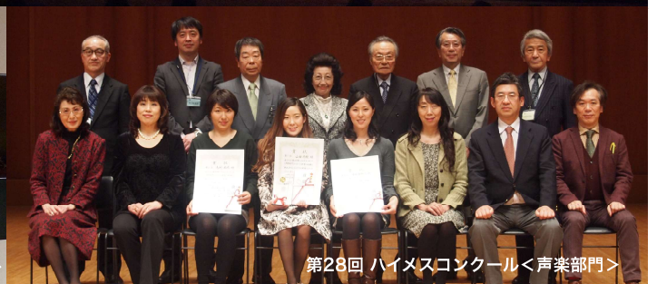
第28回 ハイメスコンクール<声楽部門>