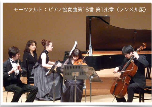
モーツァルト：ピアノ協奏曲第18番 第1楽章（フンメル版）