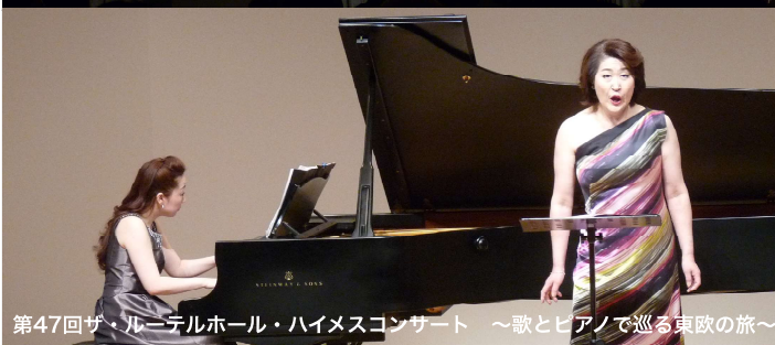
第47回ザ・ルーテルホール・ハイメスコンサート ～歌とピアノで巡る東欧の旅～