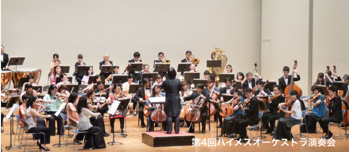
第4回ハイメスオーケストラ演奏会

Hokkaido International Music Exchange Society News Letter